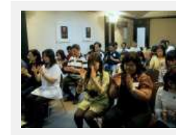
Latihan merasakan getaran kasar dan getaran halus